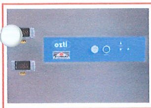
แผงควบคุมการทำงานและ การแสดงผลอุณหภูมิแบบดิจิทัล