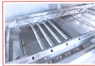
แขนฉีดส่วนล่าง สแตนเลส เกรด IPX5 ไม่ทำให้เกิดสนิม